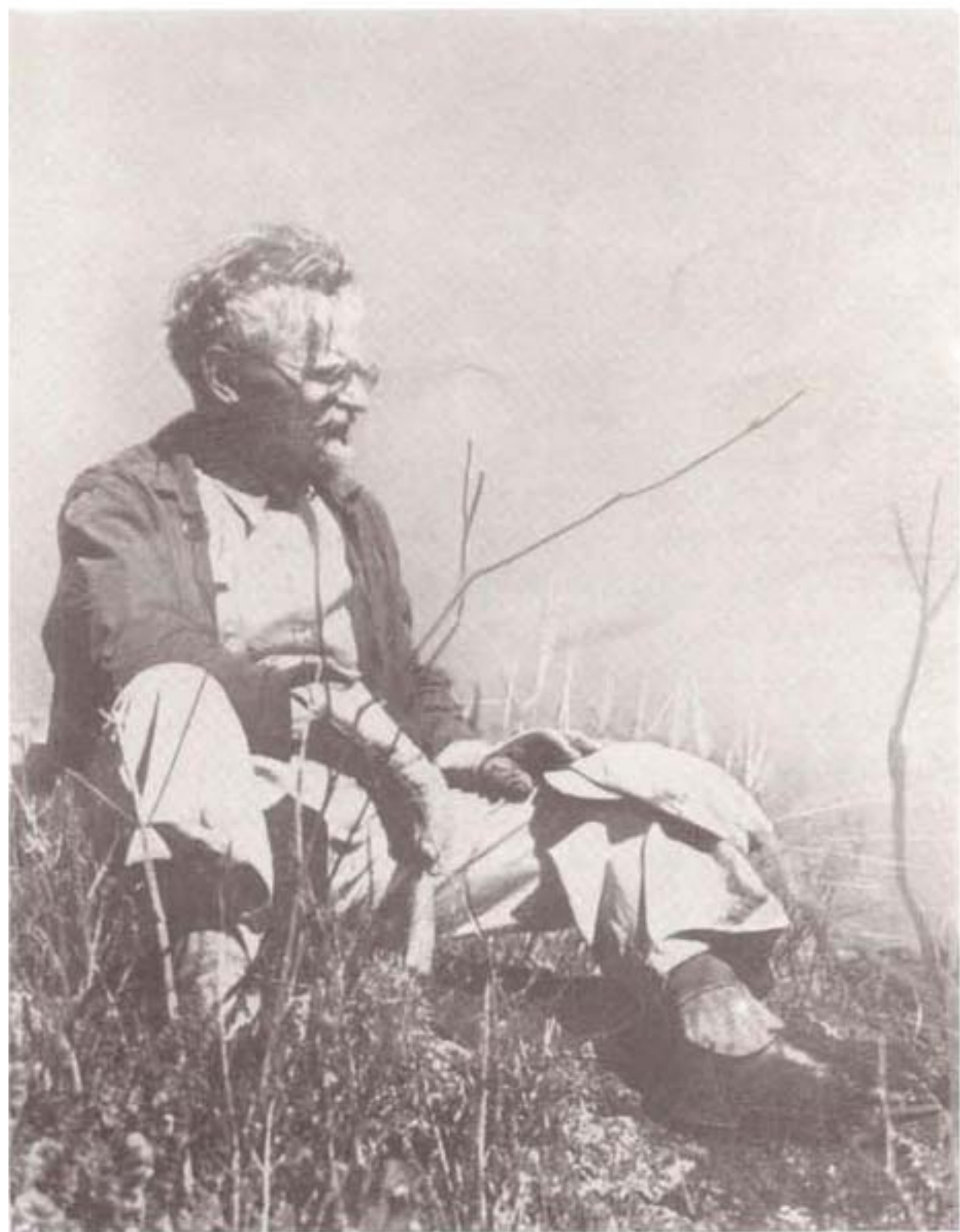
قووتسکی در مکزیک، ۱۹۴۰: دریکی از آخرین گردشهایش