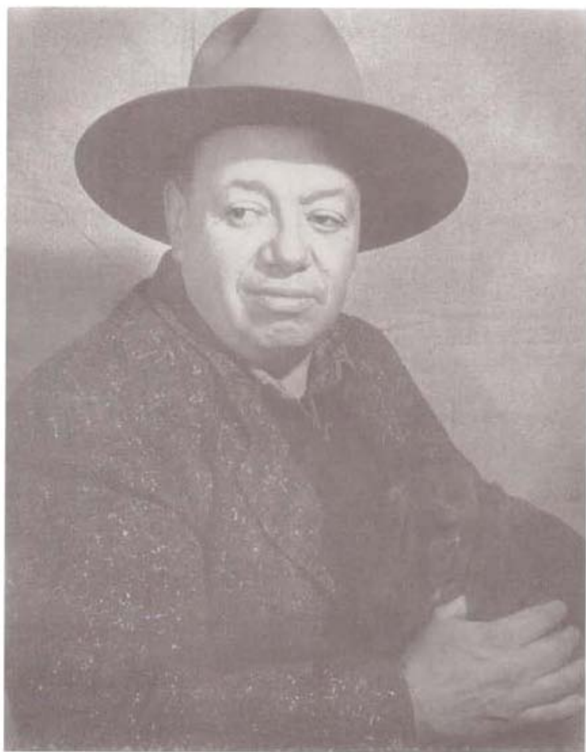
دیگو ریورا، نقاش