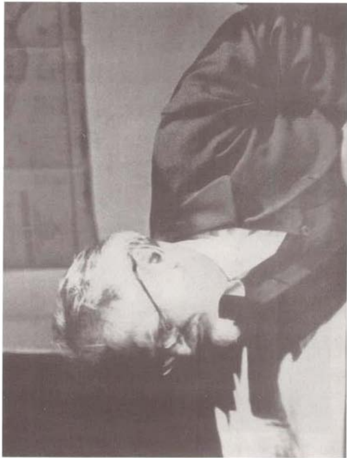
تروتسکی، پشت میز کارش