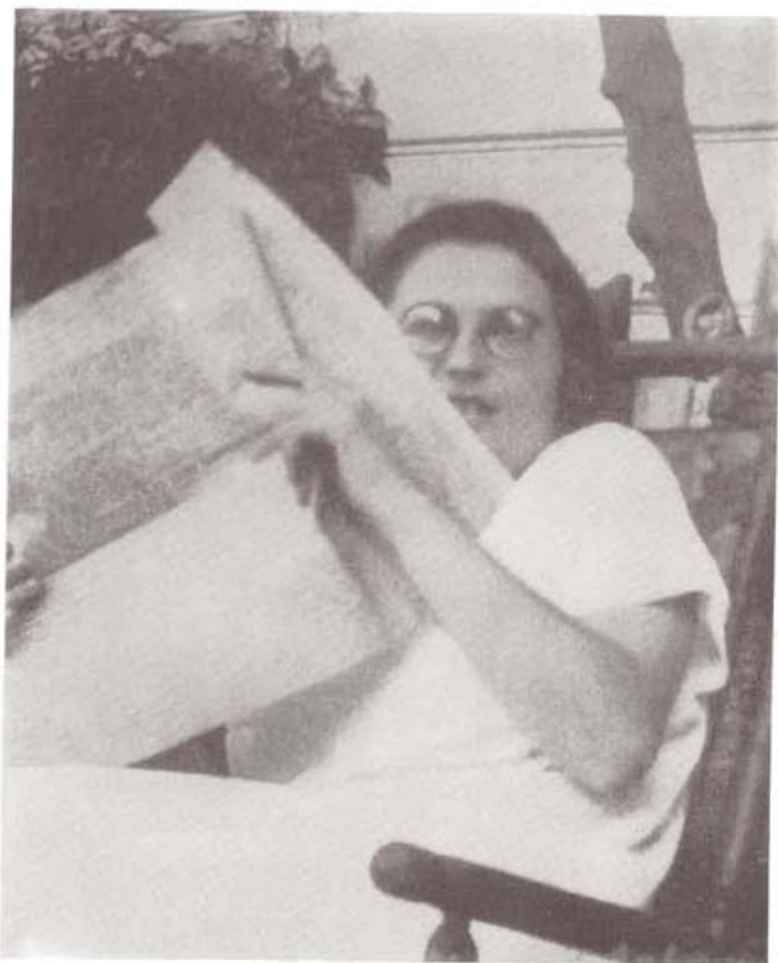
زینا، دختر تروتسکی، اندکی قبل از خودکشی