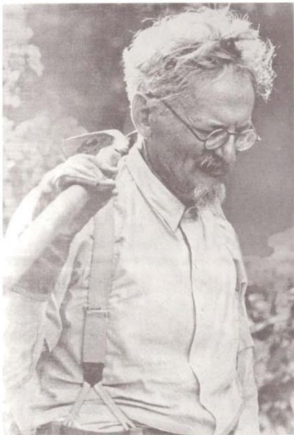
تروتسکی در جست و جوی کاکتوسهای کمیاب