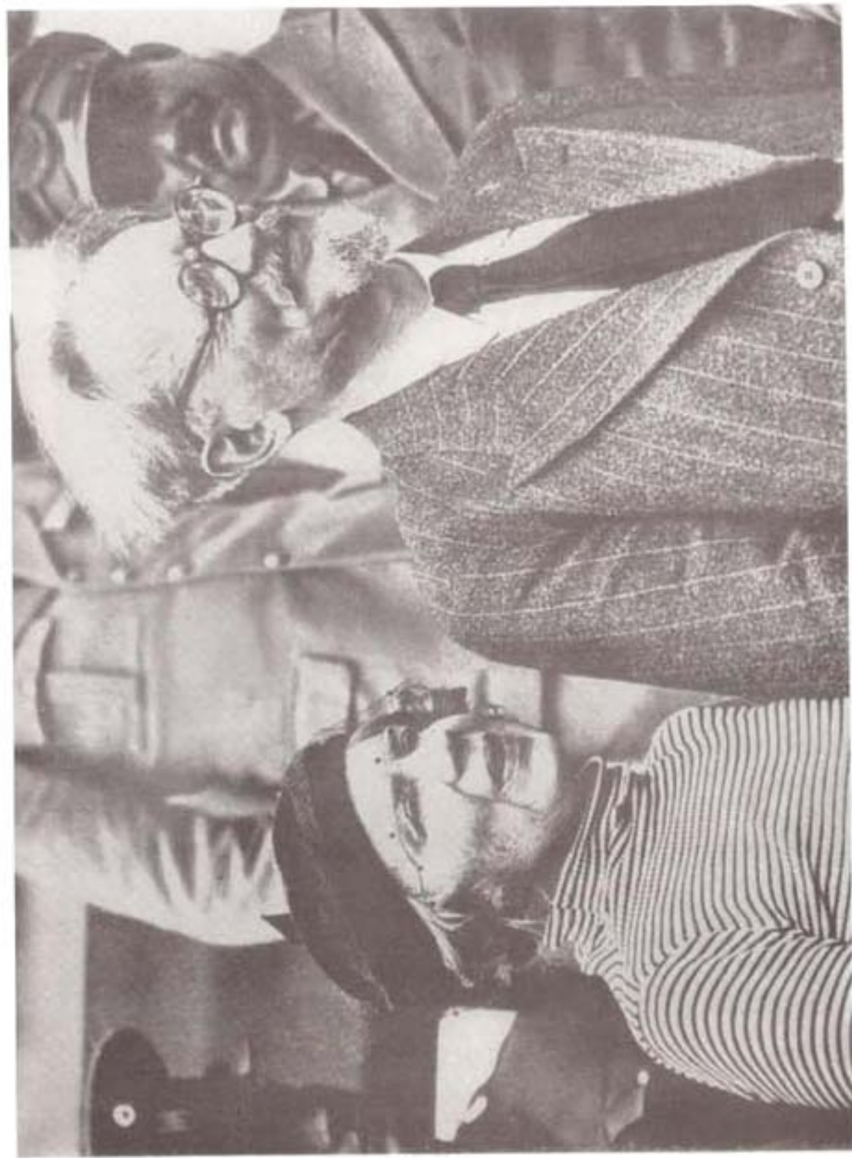
تروتسکی و ناتالیا، همسرش: ورود به مکزیک، ۱۹۳۷ میلادی