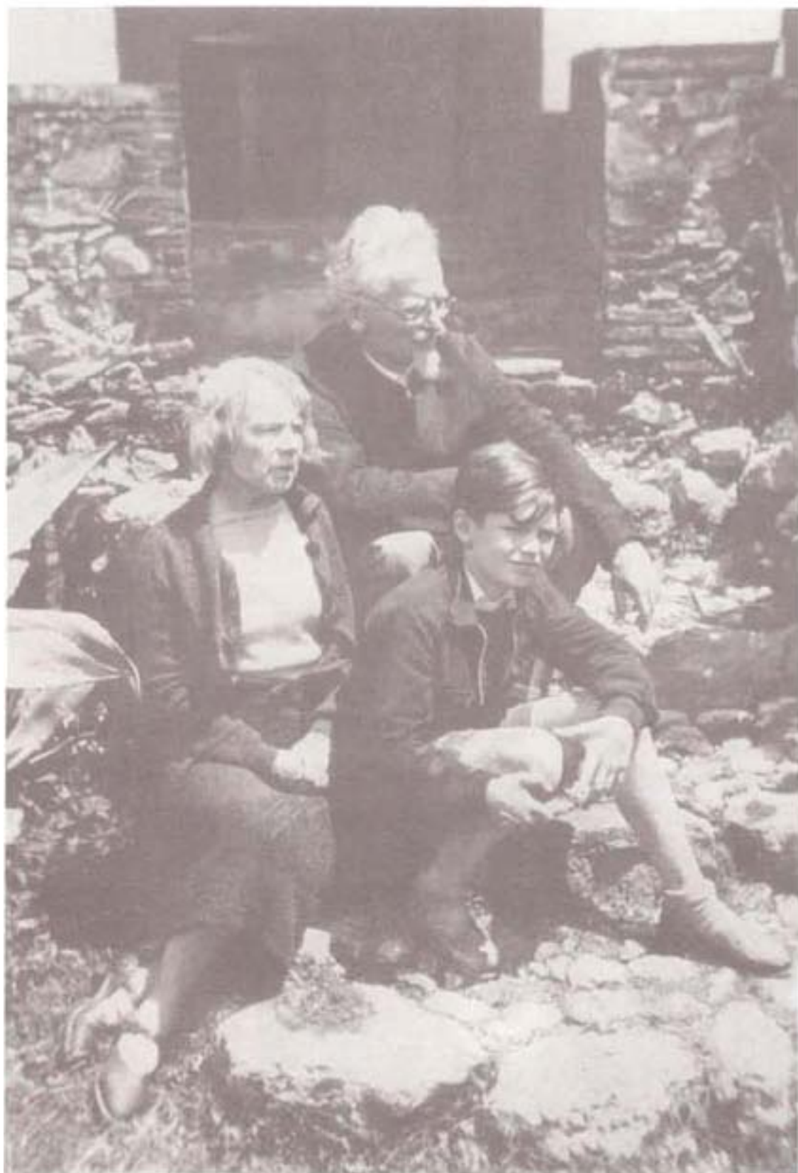
تروتسکی، ناتالیا و سدووا در پایان سال ۱۹۳۹