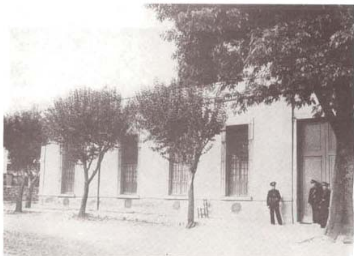
دو عکس از «دژ کوچک» در کویونکان